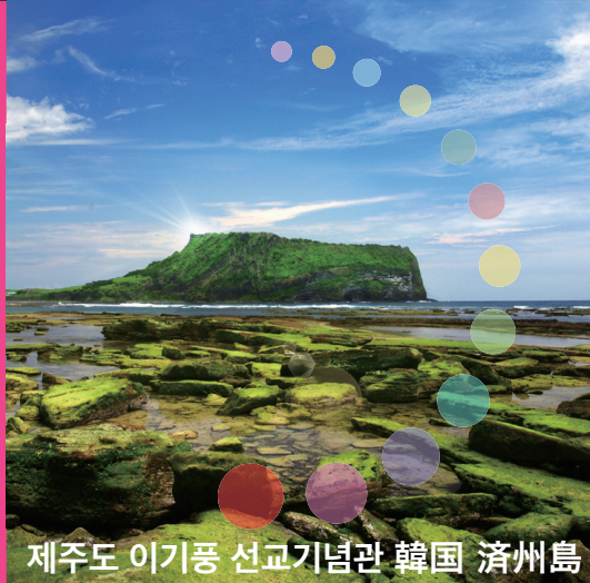
제주도 이기품 선교기념관 韓國 濟州島